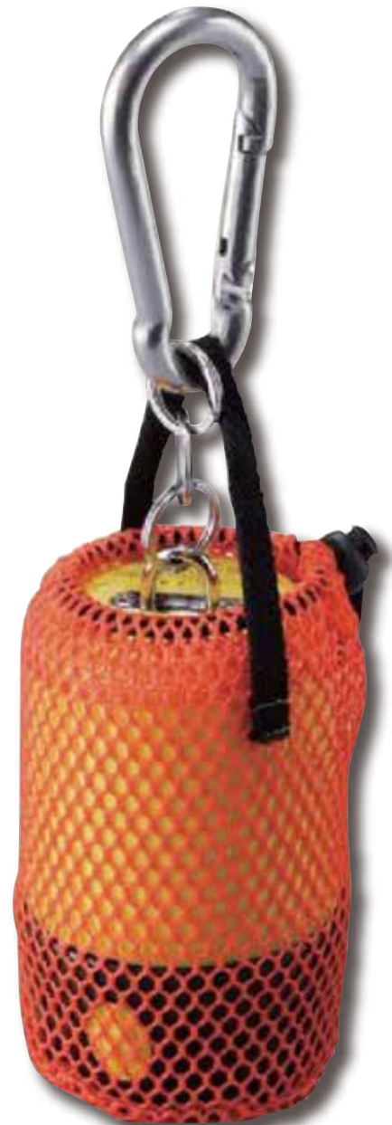
▲セット内容 玉掛警報器本体・保護カバー・スナップフック・取扱説明書