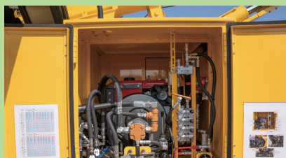
非常用エンジン（製品と異なります）