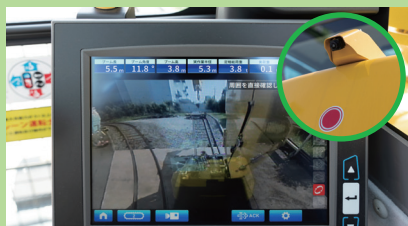
マルチアシストビュー（カメラ・モニター）