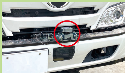
フロントセンサー