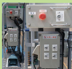
上部操作BOX&フットペダル