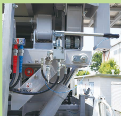
非常用ハンドポンプ