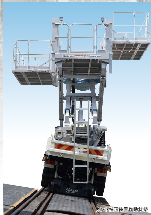
カント補正装置作動状態