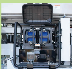
交換式バッテリー (Honda製)