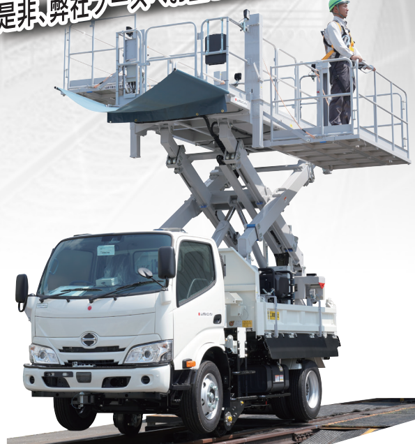
鉄道用トンネル点検Xリフト 交換式バッテリータイプ