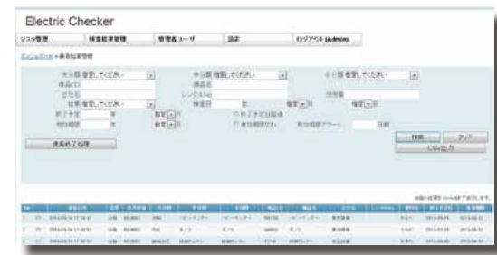
ステッカーのQRコード読み取り