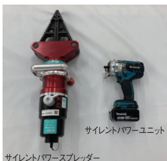
サイレントパワースプレッター