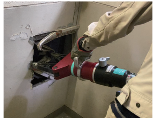
ダストシュート解体風景