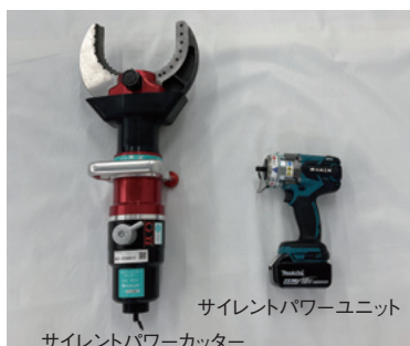
サイレントパワーユニット サイレントパワーカッター