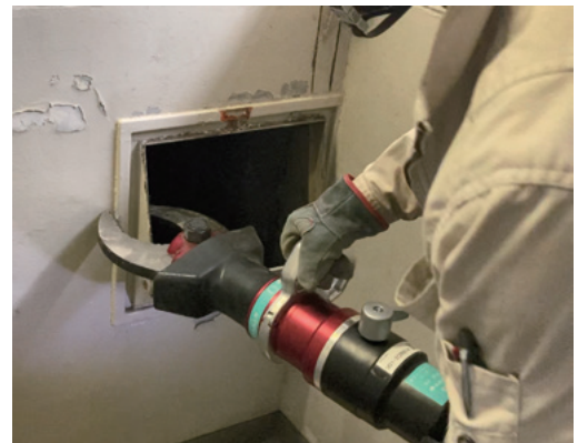
ダストシュート解体風景