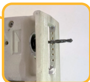
超硬パネルビット(別売)