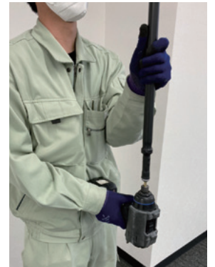
サイドドライバーと併用を推奨