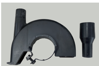
集塵機アタッチメント