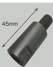
サイカップ延長軸