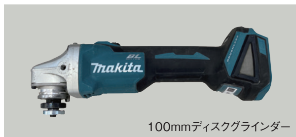
100mmディスクグラインダー