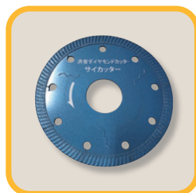
サイカッターディスク