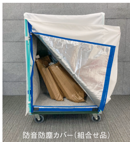
防音防塵カバー(組合せ品)