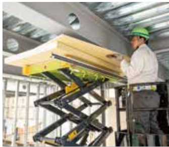
次世代資材運搬&揚重機 スカイテーブルDiana(ディアナ)