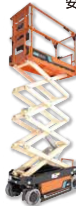
オイルフリー全電動 リチウムイオンバッテリー テーブルリフト 5.8M