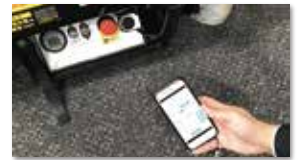
スマートフォンが鍵になる