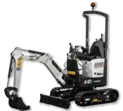
電動コンボ 0.03 m 3 後方小旋回ゴム