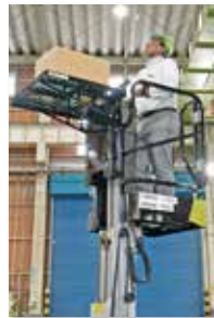
次世代電動走行作業台 スカイランナーApollo(アポロ)