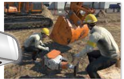
安全体感 VRトレーニング