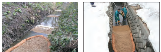
河川への油流出対応