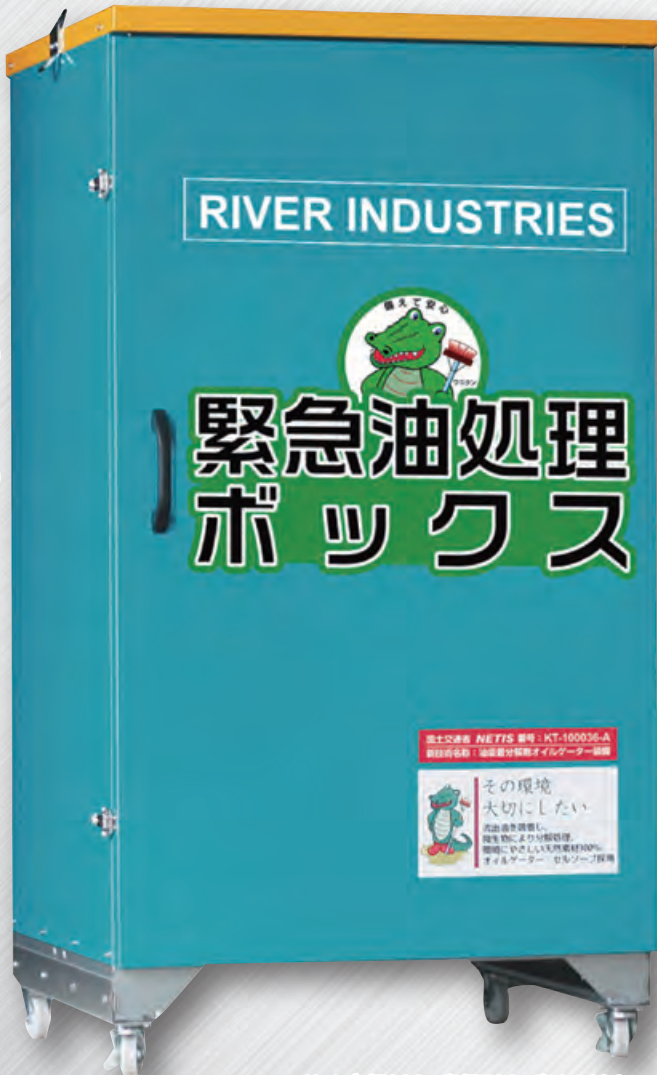
サイズ:幅903×奥行790×高さ1686mm