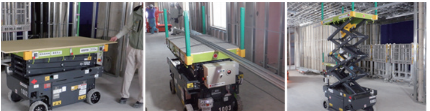
■スカイテーブルにパネルを積んだ状態