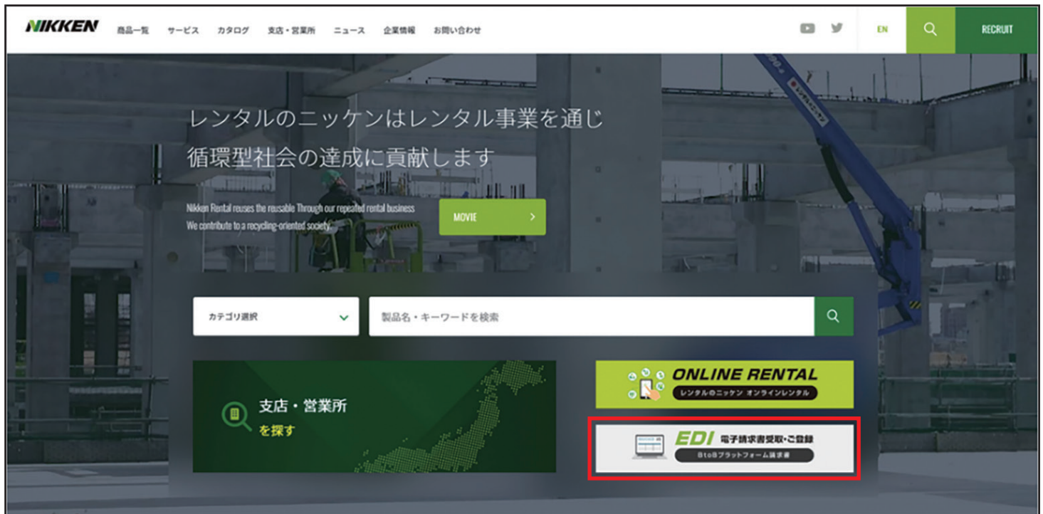
■レンタルのニッケンホームページEDI特集サイト(赤枠内)