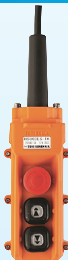
▲非常停止付 ペンダントスイッチ