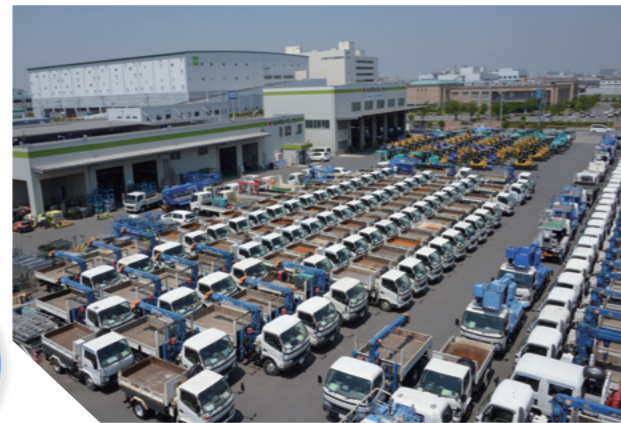
関東鉄道サービス工場