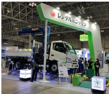
①コラム式重量物運搬車

当社ブースでは、中央に「新型コラム式重量物運搬車（写真①）」を展示。こちらは、吊上げ作業時にヒューマンエラーによるブームの架線への接触を物理的に防止する機能を追加し、コラム式の為、積載物を荷台前方へ引込む事が可能です。さらにカント補正装置と、脱着式リモコンも完備し、お客様がより安全に作業を行うことが可能になりました。意外な注目商品としましては、「ホームドア軽量カバー（写真②）」です。この商品は、お客様の「困った」の声を受け誕生したもので、2連使用で約5kgと軽量なことで、下部スカートでホームドアをスパッタから保護し、三角屋根構造で落下物からの衝撃をも軽減。マジックベルトで風にも強いことが特徴です。また、パートナー会社様と共同開発いたしました「可搬型2極1灯式LED【赤・黄】（写真③）」は、超軽量で、1台2役の黄色表示・赤色表示が可能となった商品です。いずれの商品も当日お立ち寄りいただいたお客様からは、「こんな商品が欲しかった」という嬉しいお声を多数いただき、関心を集めておりました。