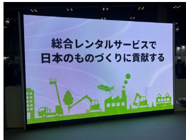
⑥ 屋外用大型サイネージ