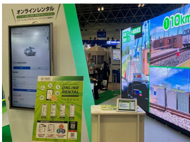
④ オンラインレンタル

他にも、登録開始からお客様にご好評をいただいております、オンラインレンタルの展示・説明（写真④）や、新たなコンテンツが加わったVRコンテンツリンクの体験ブース（写真⑤）も設置いたしました。更にお立ち寄りいただいたお客様が思わず足を止めていた屋外用大型サイネージ（写真⑥）は、映像の美しさもさることながらその大きさにも圧倒されており、現場で採用したいなどのお問い合わせも多くなりました。