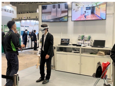
⑤ VR コンテンツリンクの体験