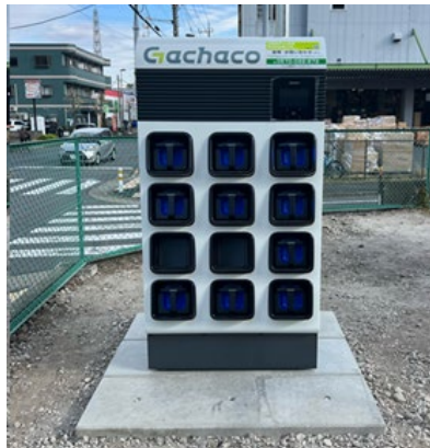
弊社東保木間1丁目ステーション（レンタルのニッケン駐車場）に設置されたGachacoステーション