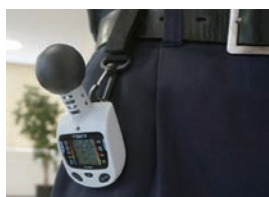
ベルト装着イメージ